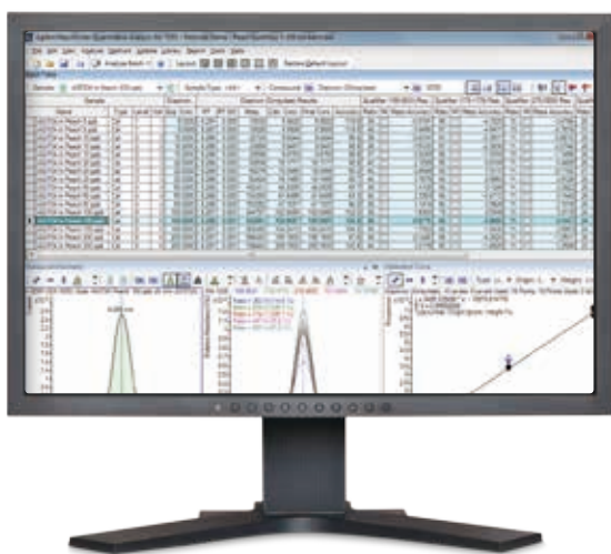
MassHunter Quantitative Analysis による結果とデータの確認