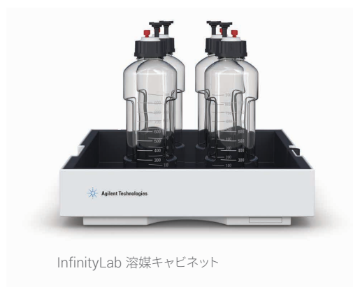
InfinityLab 溶媒キャビネット

新しい溶媒ボトルは、InfinityLab ファミリの一部です。LC ワークフローにスムーズに組み込むことができます。多くの利点を備えたボトルを使用することで、ラボの日々の運用効率を高めることができます。