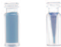
赤ラバーセプタム (19 m)、5 mL および 10 mL スナップキャップ用、8010-0340