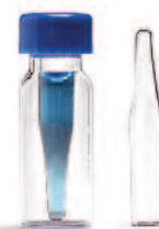
250 µL 先細ガラスインサート、8010-0132