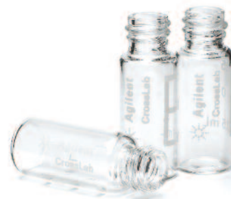
透明、2 mL 細口 (8 mm) スクリューガラスバイアル、8010-0011