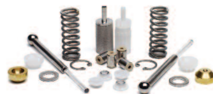
515 ポンプ PM キット、8005-0913