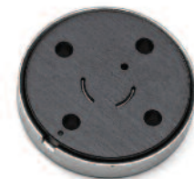
ベスベルロータシール、Rheodyne 7725(i) 用、 8005-0604