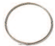
CrossLab キャピラリー、 ステンレス製、 8005-0823