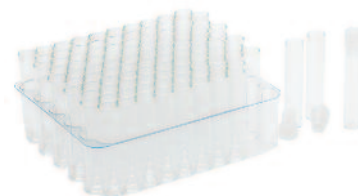
CrossLab バイアル、スナップシェルバイアル、 1 mL、8 mm、透明、ポリプロピレンキャップ付、 8010-0574

バイアルとキャップの確実なマッチングのために、アジレントでは、CrossLab バイアルアセンブリ (バイアル、キャップ、セプタム、バイアルインサートなど) を統一して導入されることを推奨いたします。CrossLab バイアルと他のブランドのキャップ、または CrossLab キャップと他のブランドのバイアルを組み合わせて使用しないようにしてください。