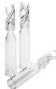
250 µL コニカルインサート、樹脂脚付、 8010-0131