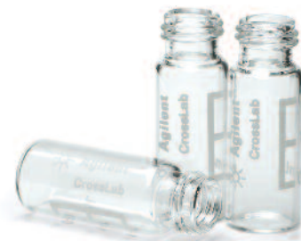
透明、2 mL 広口 (9 mm) スクリューガラス バイアル、8010-0015