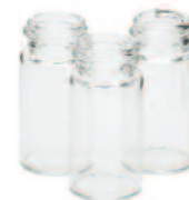
CrossLab バイアル、スクリュートップ、10 mL、22 mm、透明、8010-0563