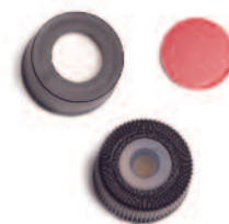
黒スクリューキャップ、4 mL (13 mm) バイアル用 赤 PTFE/シリコンセプタム付、8010-0095