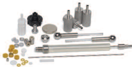
2960/2965 PM キット、8005-0915

参考部品番号をご覧いただくと、現在ご使用中の製品の代替製品としてお使いいただける Agilent CrossLab 製品がわかります。CrossLab 製品は対応する他社機器と互換性がありますが、場合によっては、CrossLab 製品の設計が対応する製品とわずかに異なることがあります。すべての CrossLab 消耗品は、アジレントの 90 日間の保証付きです。