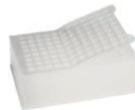
96 ウェルプレート、 交換型シーリングマット付き、8010-0534