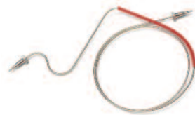
CrossLab キャピラリー、ステンレス製、 8005-0825