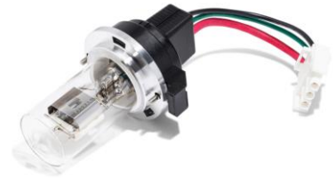
G1314-60101 重水素ランプ, RFID 付, VWD 用