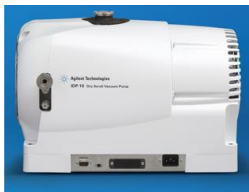
G6697A IDP-10オイルフリーポンプ