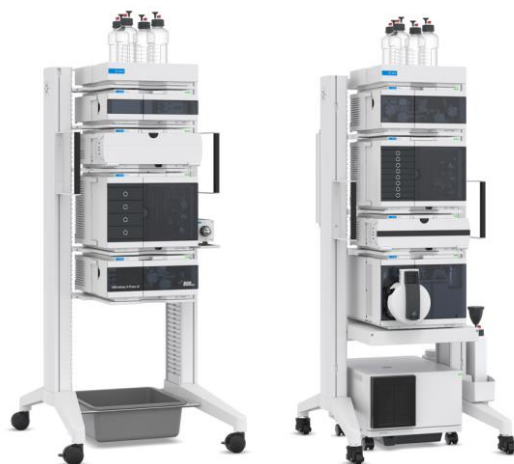
InfinityLabフレックスベンチ

- MS も含めて移動が容易な床置き型で、ラボ全体の機器の配置を最適化できます。InfinityLab MSD や Ultivo LC/MS システムを最下段に搭載することができ、各部を操作しやすくなります。