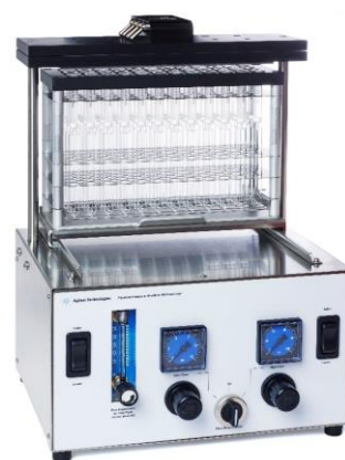
SPEカートリッジ 48本用