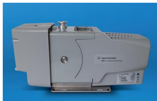
G6696A IDP-3オイルフリーポンプ

170 L/m (10.2 m 3 / hr) の排気速度を実現しています。Agilent 7000 および 7010 シリーズのトリプル四重極 GC/MS システムで使用できます。