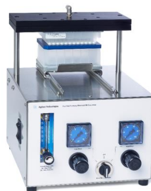
96ウェルプレート用