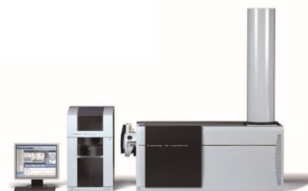
キャピラリー電気泳動 CE/MS