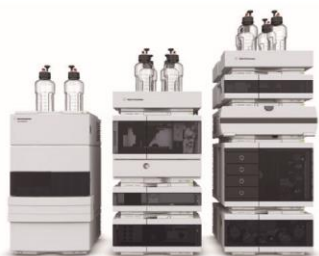
Infinity Lab LC シリーズ

アジレント・テクノロジーは、世界の分析機器業界で高い販売実績を誇るリーディングカンパニーです。もしご興味のある製品がありましたら、お気軽にお問合せください。