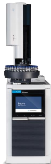
Intuvo 9000 GC取付例