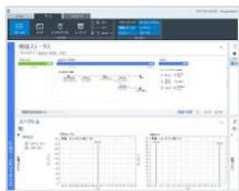
OpenLab CDS 2.2