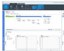
OpenLab CDS 2.7