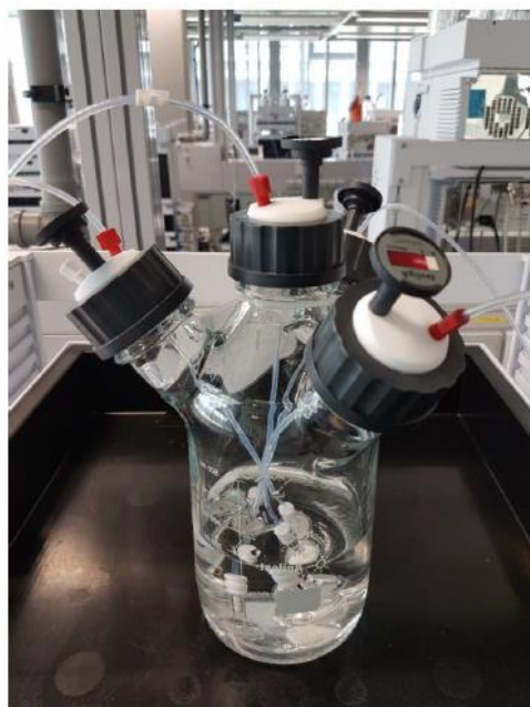
新たなスタイルの提案