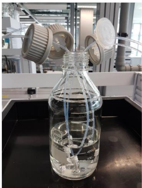
アンバランスな設置

従来の開放系でのアンバランスな設置から、 新たな安全重視で快適なラボ環境作りをアジレントは提案します。